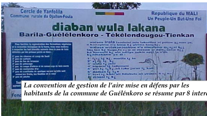
La convention de gestion de l'aire mise en défens par les habitants de la commune de Guélélenkoro se résume par 8 interdictions.

Un deuxième financement du PPS/FEM en 2004 a été octroyé pour appuyer les populations dans la construction d'un régulateur de niveau d'eau pour assurer la disponibilité d'eau pour la faune pendant la saison sèche.