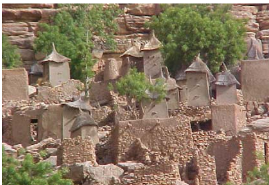
Par l'assainissement communautaire des villages de Bandiagara le projet a renforcé la conscience environnementale des habitants du pays dogon.